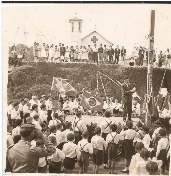
ANTIGA IGREJA, ONDE ESTÁ A IGREJA SÃO JOÃO BATISTA.