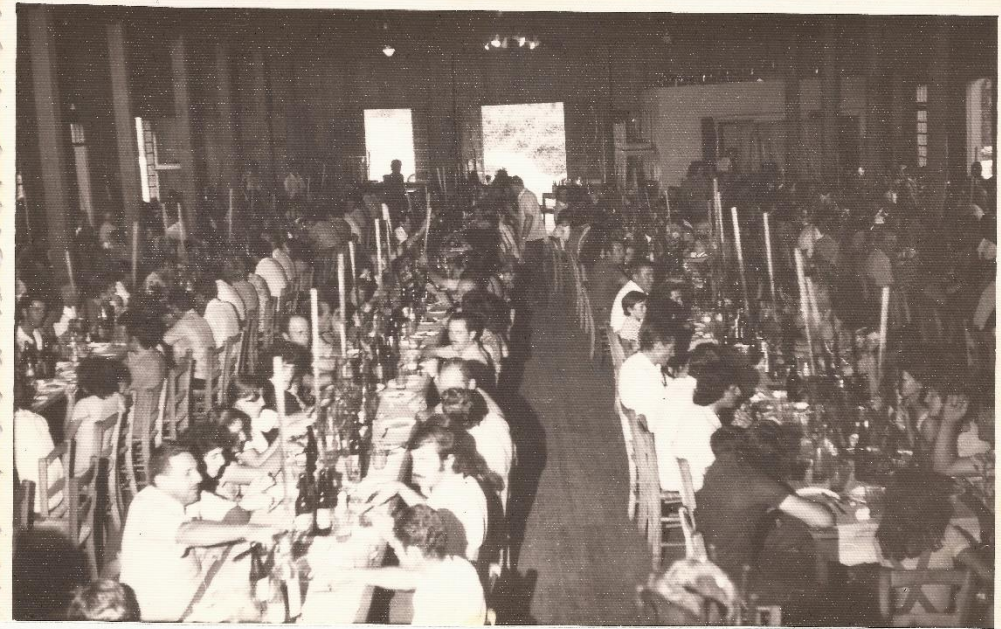
FESTA DE SÃO JOÃO, INTERIOR DO CLUBE ITAGIBA EM 1958