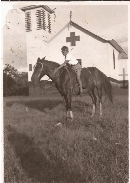
IGREJA CATÓLICA, ONDE ESTÁ A IGREJA SÃO JOÃO BATISTA.