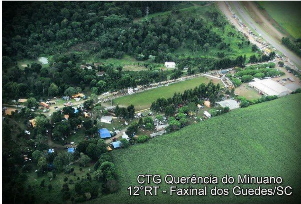
CTG Querência do Minuano 12°RT - Faxinal dos Guedes/SC