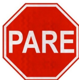
Figura 3: Placa de Sinalização R-1 – Parada Obrigatória.

O posicionamento da placa deve ser colocada no lado direito da via, conforme especificado em projeto, o mais próximo do ponto de parada do veículo.