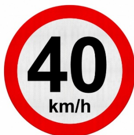
Figura 3: Placa de sinalização R-19 – Velocidade Máxima

Regulamenta o limite máximo de velocidade em que o veículo pode circular na pista ou faixa, válido a partir do ponto onde o sinal é colocado.