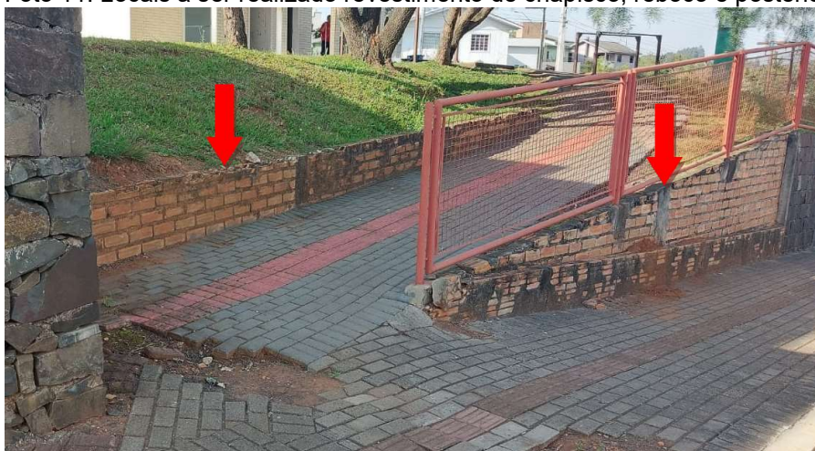
Foto 11: Locais a ser realizado revestimento de chapisco, reboco e posterior pintura.

O revestimento de chapisco e argamassa, deverá ser executado nos locais onde se tem tijolo aparente, demonstrados através da Foto 11, abaixo.