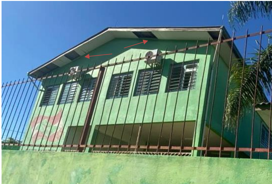
Imagem 10 – Abas a serem instaladas.

Será necessário a execução de novas abas nos locais danificados e, nos locais inexistentes, conforme imagem abaixo.