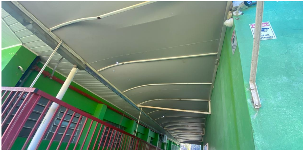
Imagem 01 – Toldo a ser substituído.

Av. Rio Grande do Sul, 50 - Centro CEP 89694-000 - FAXINAL DOS GUEDES - SC Fone/Fax: 49 3436-4300 - Site www.faxinaldosguedes.sc.gov.br CNPJ 83 009 910/0001-62