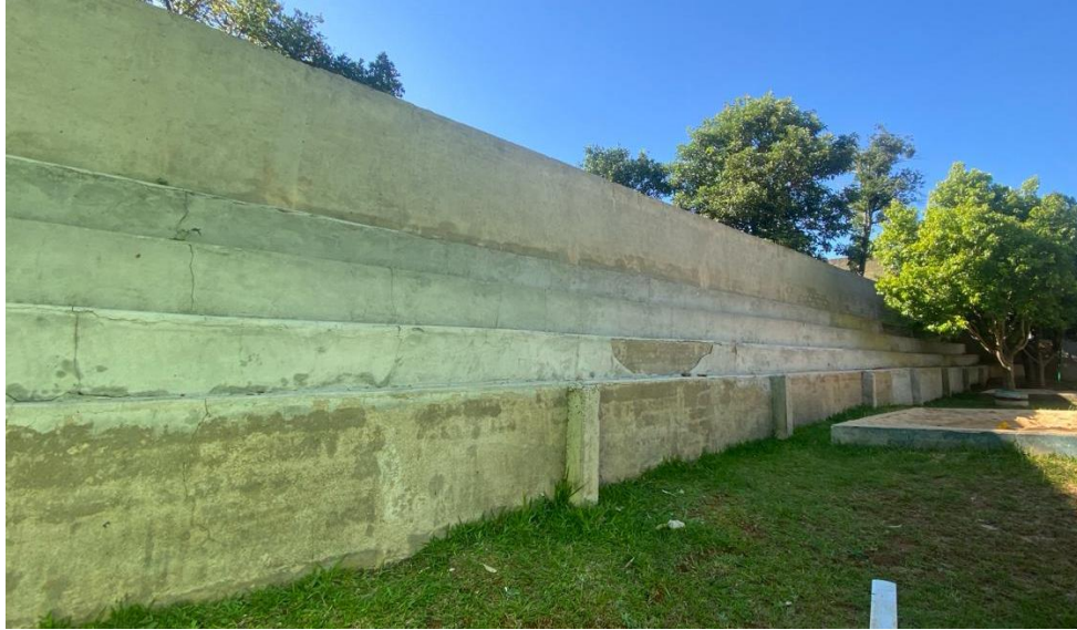
Imagem 09 – Arquibancada execução de chapisco, reboco e pintura.

Av. Rio Grande do Sul, 50 - Centro CEP 89694-000 - FAXINAL DOS GUEDES - SC Fone/Fax: 49 3436-4300 - Site www.faxinaldosguedes.sc.gov.br CNPJ 83 009 910/0001-62